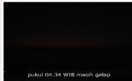
pukul 04.34 WIB masih gelap