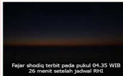
Fajar shodiq terbit pada pukul 04.35 WIB 26 menit setelah jadwal RHI