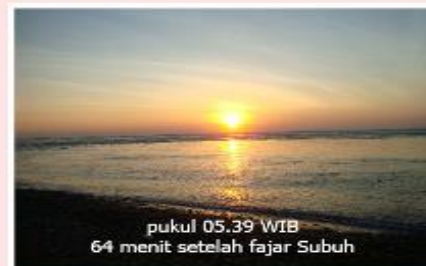
pukul 05.39 WIB 64 menit setelah fajar Subuh