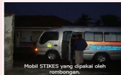
Mobil STIKES yang dipakai oleh rombongan.

Berdasarkan Badan Rukyatul Hilal Indonesia (RHI) jadwal waktu Subuh daerah Banyuwangi tanggal 25-26- Juni 2009 adalah 04.09 WIB