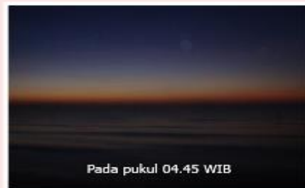
Pada pukul 04.45 WIB