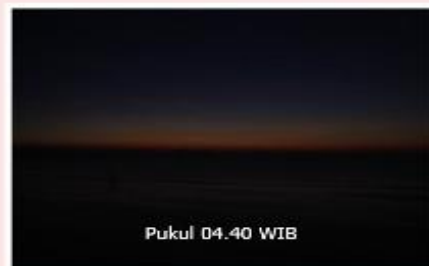
Pukul 04.40 WIB